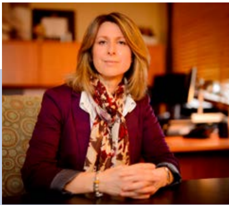
Commissaire aux divulgations dans l'intérêt public du Yukon Diane McLeod-McKay